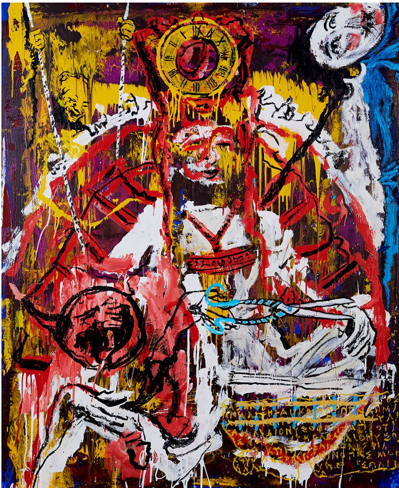
DEFIXIO 120 x 120 cm / Huile & Glycéro sur toile