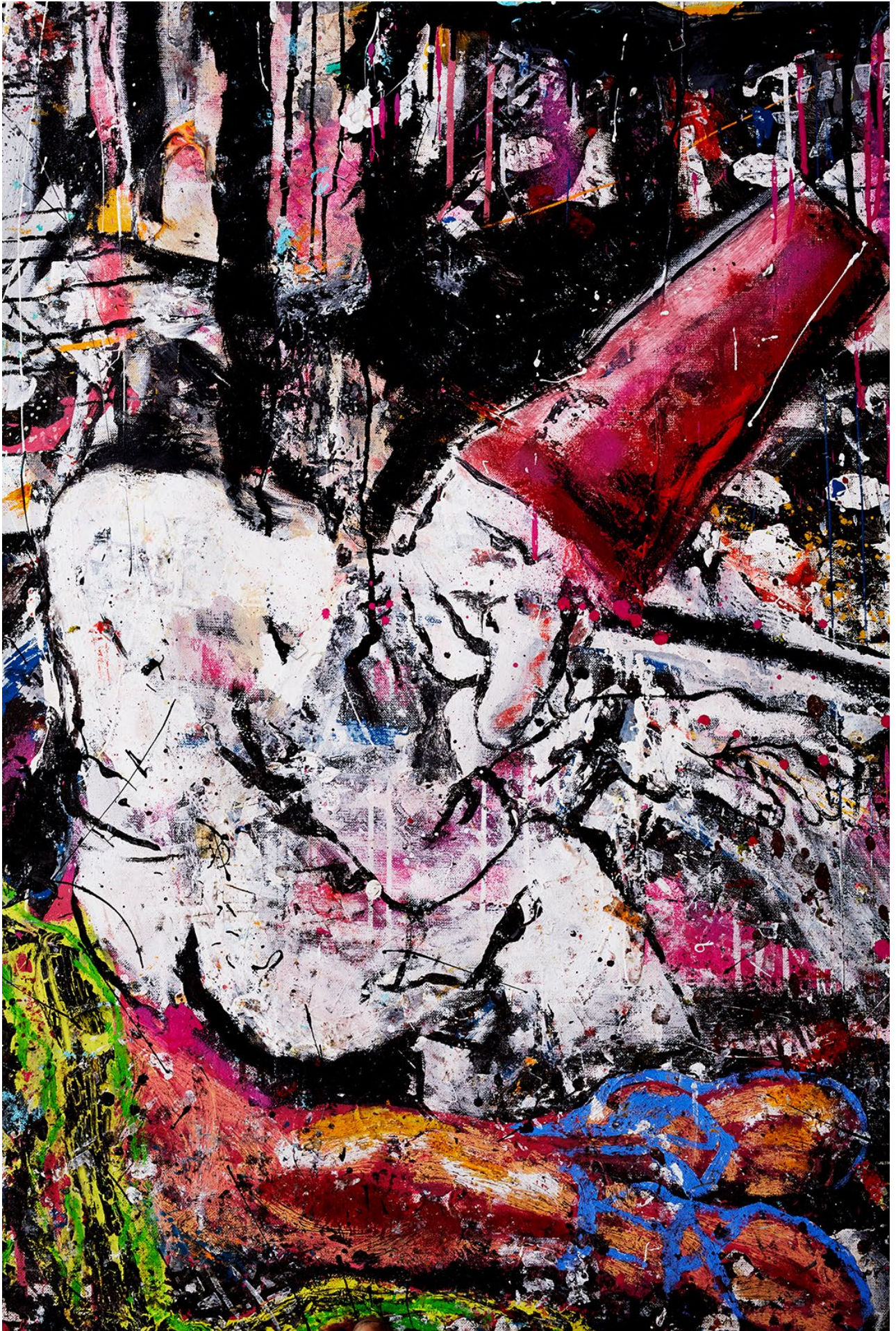
SLUAGHGHAIRM SPERM (Détail) 270 x 250cm / Techniques mixtes sur toile