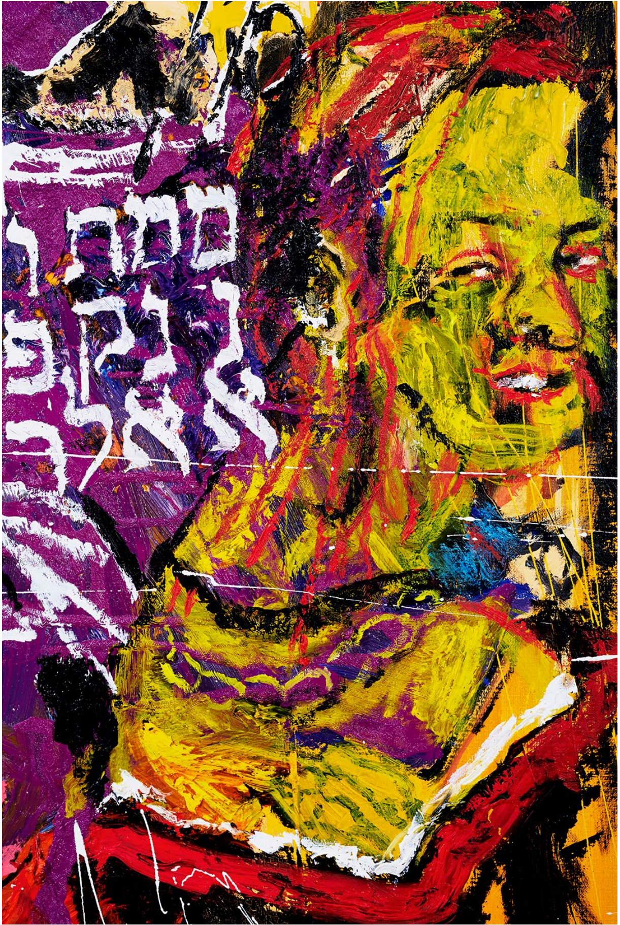
PROZESS (Détail) 130 x 195 cm / Huile & Glycéro sur toile