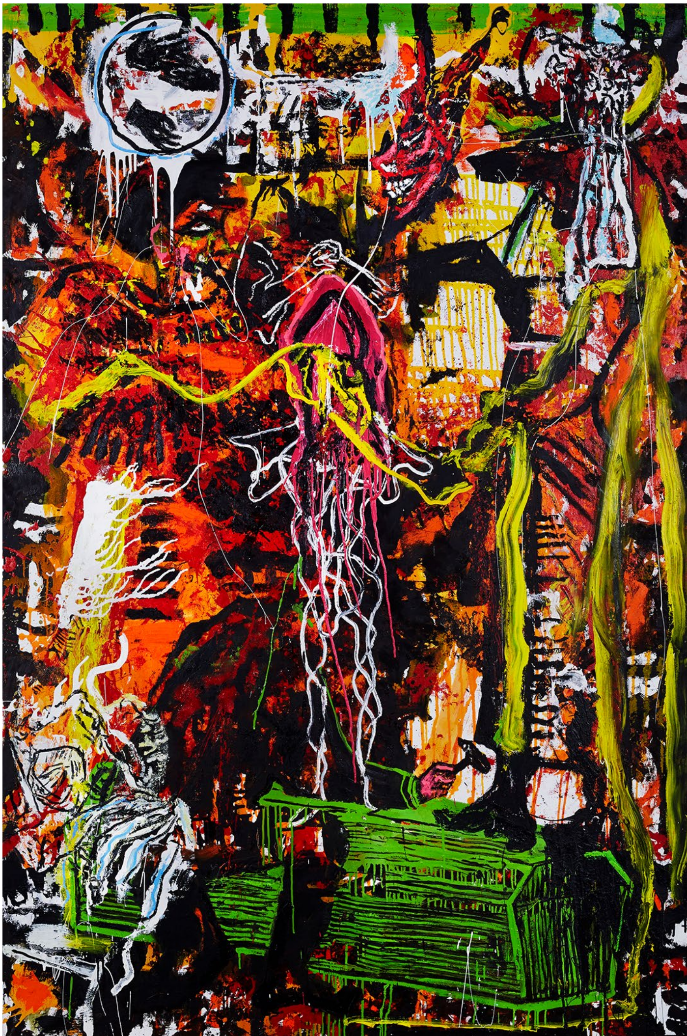
MÂÂT 210 x 140 cm / Huile & Glycéro sur toile